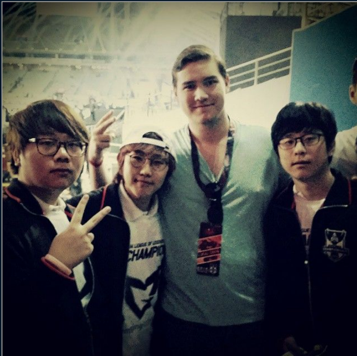
Ég ásamt heimsmeisturunum í League of Legends í Suður Kóreu 2014