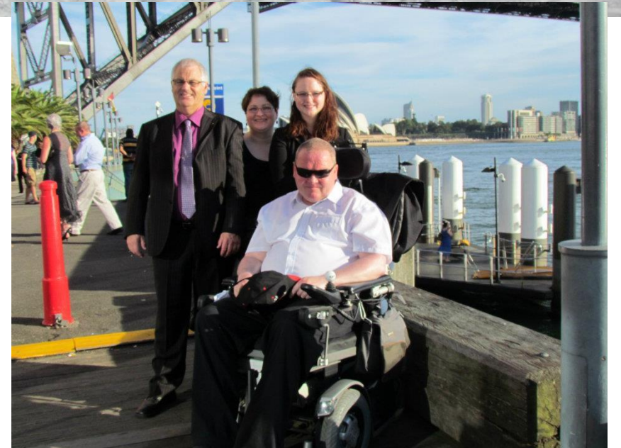
Aōgengi 2014 MND/SEM