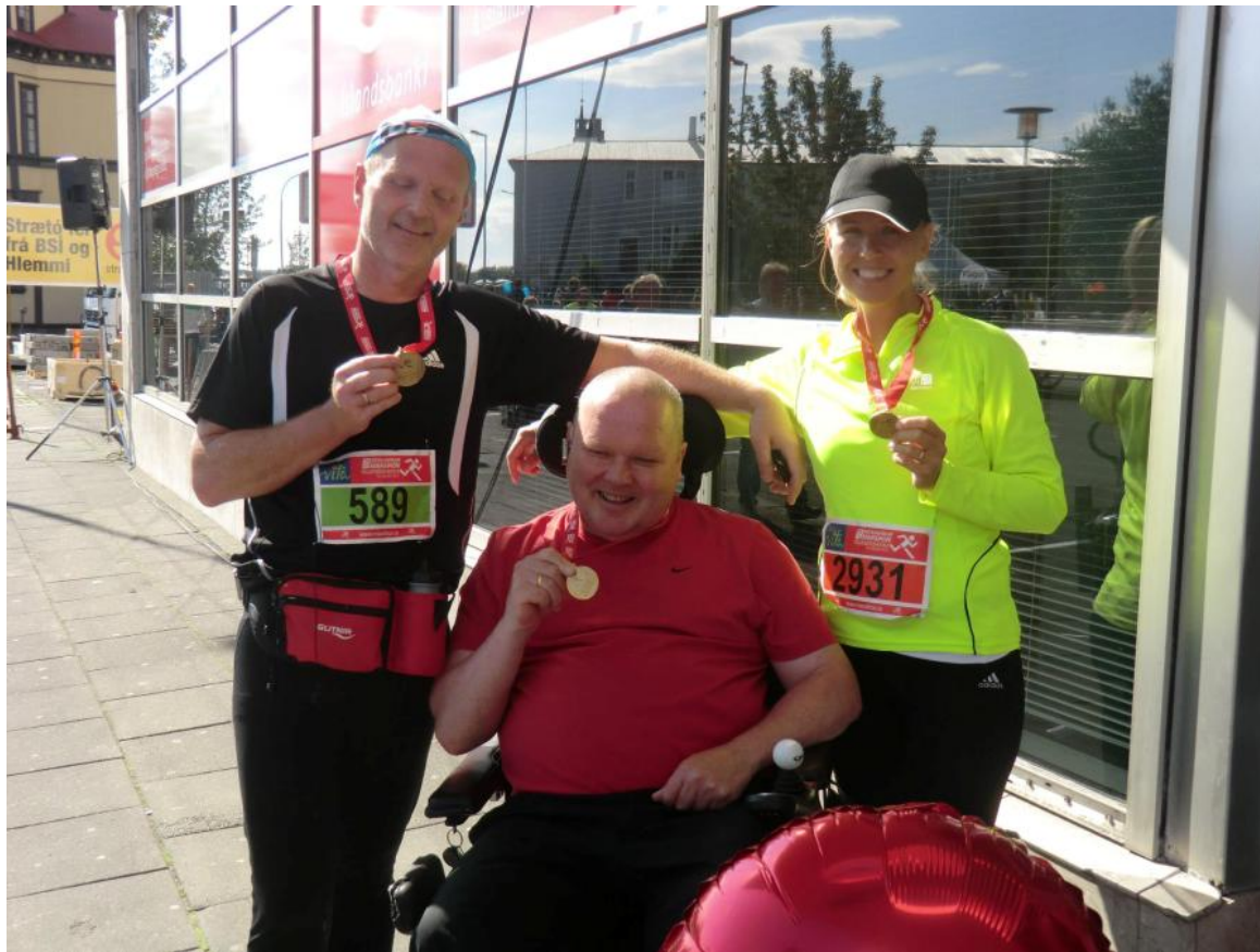
Aðgengi 2014 MND/SEM